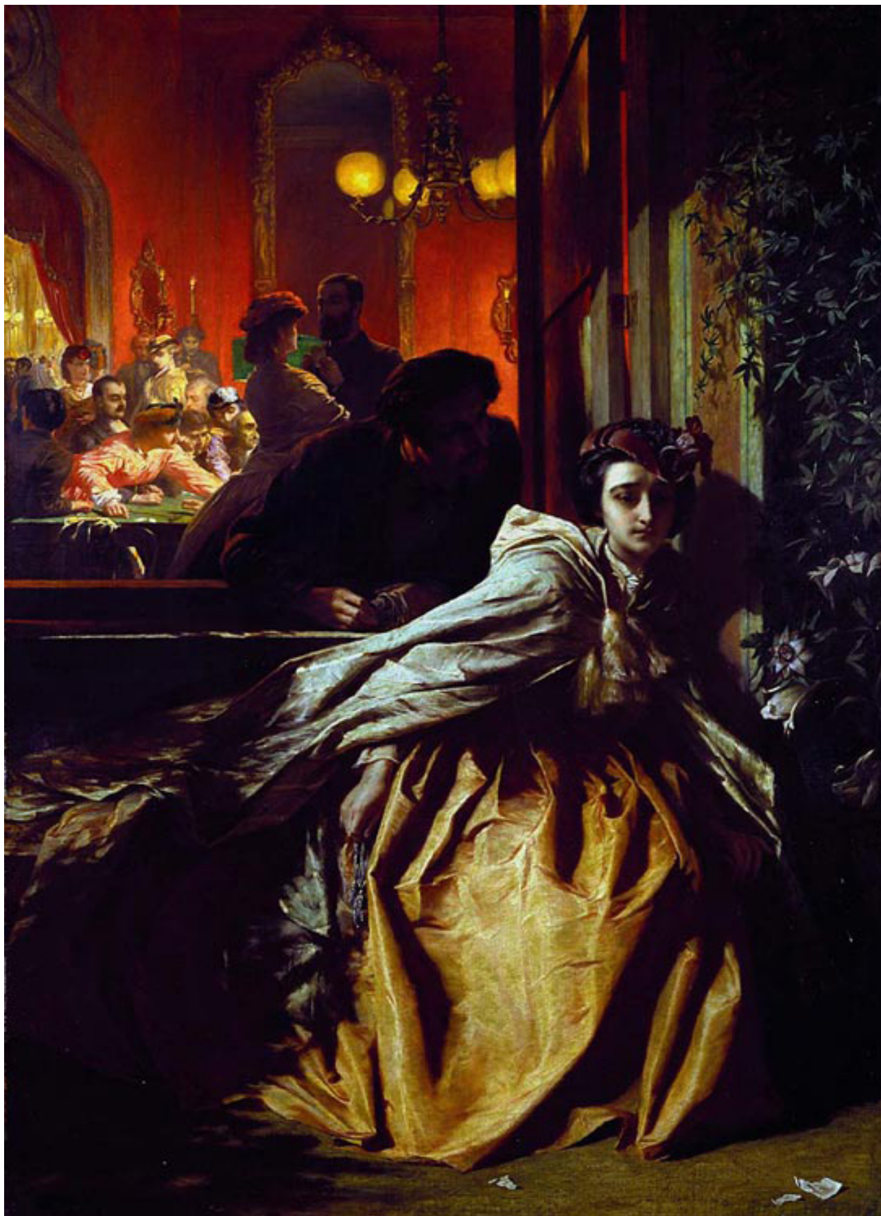
Figura 1. Pintura com o título On the Brink , de Alfred Elmore, 1864, óleo sobre tela, com dimensões 113.7 cm × 82.7 cm (44.8 in × 32.6 in) exposta no Fitzwilliam Museum, Cambridge. E's [for] Mr Elmore. She's tempted to sin; She's fair. Will the lily or the passion flower win? Academy Alphabet', Punch, 13 May 1865